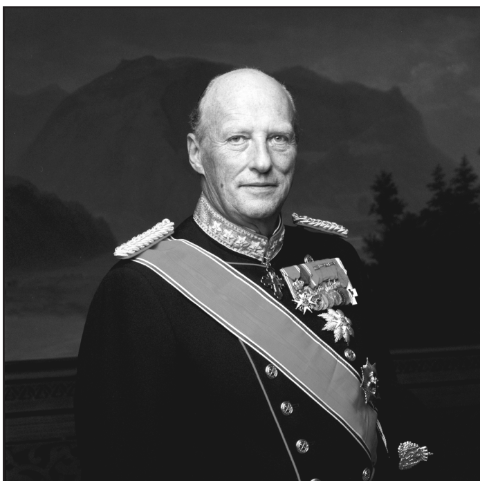
H. M. Kong Harald V Det Kongelige Norske Videnskabers Selskabs protektor