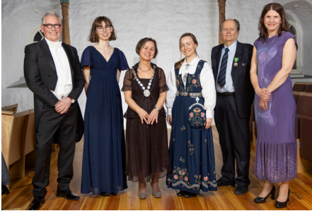
Pris- og medaljevinnere, flankert av klasselederne og preses i midten.