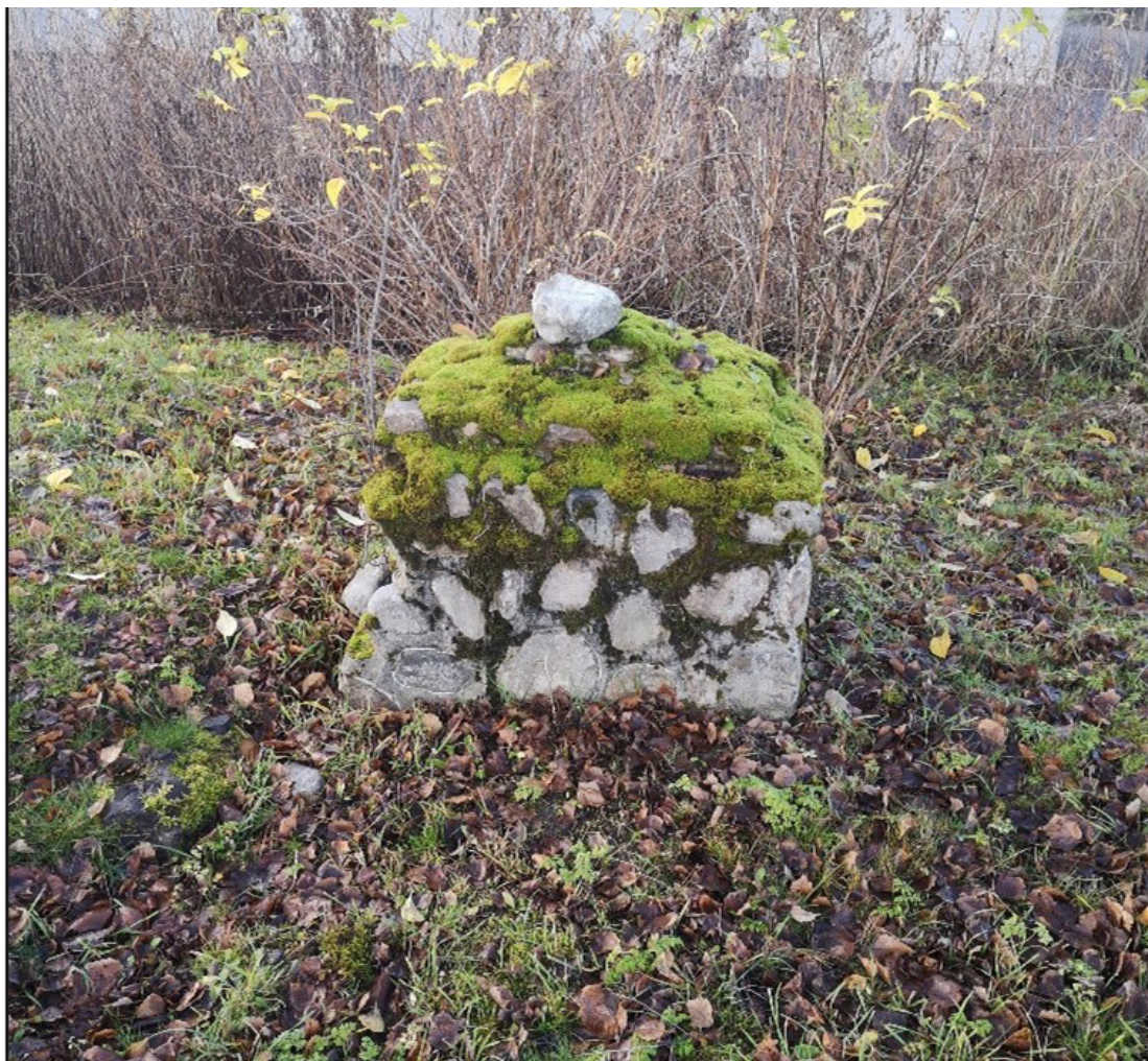
Figur 8. Fundamentet til en av fakkलगrytene.

Da Stavne æreskirkegård ble avviklet i 1955, ble de aller fleste spor etter den fjernet. Enkelte rester kan riktignok fortsatt sees. På utsiden av kirkegårdens vestlige gjerde står det tre oppmurte fundamenter på linje. Disse er sannsynligvis fundamentet til det store mønekorset, flankert av fundamentene til de to fakkलगrytene som stod på hver side av korset. Dette var det sentrale punktet i æreskirkegårdens geometri. Ved saneringen av æreskirkegården ser det ut som man ikke tok seg bryet med å fjerne dem, men heller trakk kirkegårdsgjerdet foran dem, slik at de i dag ligger delvis skjult blant busker og kratt.