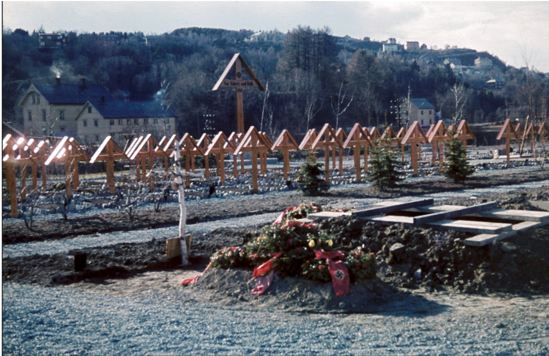
Figur 9. Stavne æreskirkegård under krigen.