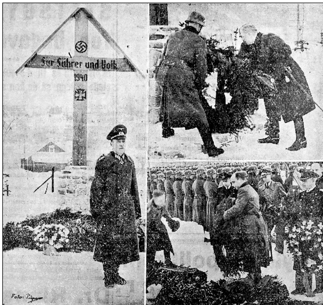
Figur 3. Faksimile fra Adresseavisen 16. mars 1943, minnedagen for de falne på Stavne.

var det i 1943 gravlagt et større antall personer som ved krigsslutt kan gjenfinnes i Havsteins gravprotokoll. Disse skal ha ligget på et «felt 5» på Stavne utenfor gjerdet til æreskirkegården. 36 Hvor dette lå, er usikkert. Gravene på dette feltet kan ha blitt flyttet til Havstein fordi de ikke lå på den formelle delen av æreskirkegården. Man hadde på dette tidspunktet også begynt å bygge Stavne-Leangenbanen, som skulle føre togtrafikk utenfor Trondheim sentrum, noe som la beslag på deler av neset kirkegården lå på. 37