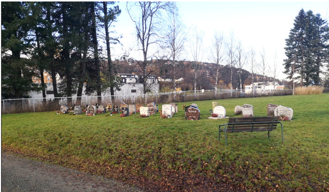
Figur 10. Samme sted i dag.

På Havstein er den materielle kulturen fra krigen fjernet, slik at gravlundens plassering og utstrekning er de eneste sporene fra okkupasjonstidens kirkegård. Flyfoto viser at det nye anlegget ble bygd direkte over det forrige, noe som har bevart aksene og siktlinjene i anlegget. Plasseringen på Havstein er et tydelig eksempel på hvordan okkupasjonsmakten ønsket å hedre sine døde. Til forskjell fra Stavne, hvor den raske bruken under invasjonen ser ut til å ha vært bestemt av foreliggende behov, ble Havstein åpenbart plassert mer planlagt. Ved etableringen i 1943 hadde okkupantene vært i Norge i tre år og hatt god tid på å bli kjent