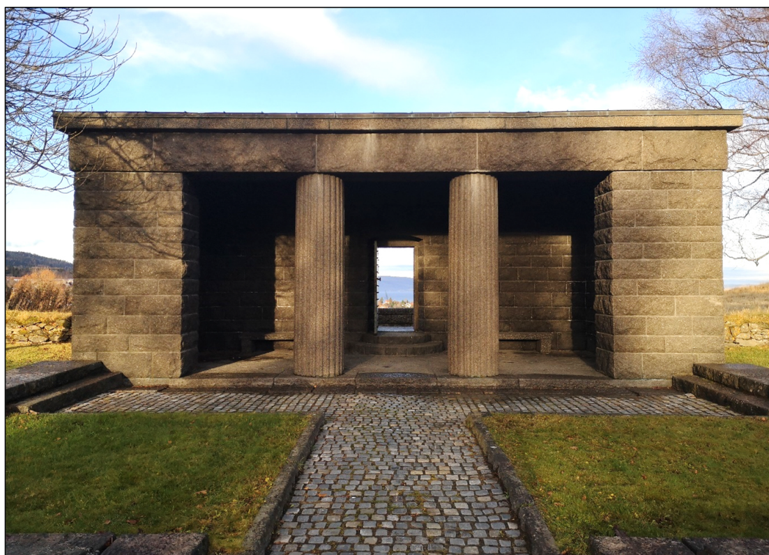
Figur 5. Gravtempelet på Havstein. Det ligger et tilsvarende på Alfaset i Oslo.

I 1955 gjorde norske myndigheter befaringer og oppmålinger på Havstein i samarbeid med ansatte i Volksbund. Tyskerne ønsket å utforme kirkegården som en gresslette uten gangstier, beholde trærne som var plantet under krigen, og plante en rekke nye bjørke-trær. 72 Anleggets grunnplan på 100 x 100 meter skulle beholdes. Ettersom gravene fra krigsårene var nummerert ulikt dem som var flyttet under operasjon «Sørty», ble det bestemt å gi kirkegården et nytt nummersystem. 73 I 1956 ble det oppført en lav steinmur rundt hele kirkegården, og snart begynte arbeidet med gravtempelet som også fungerte som inngangsparti. Utformingen av anlegget ble bestemt av Volksbunds arkitekter, mens materialer stort sett ble hentet lokalt. Arkitekttegningene ble imidlertid vurdert av den norske hagearkitekten Karen Reistad, som var sentralt involvert i gravflyttingsprosessen som statlig kirkegårdskonsulent. 74 Anlegget ble innviet i 1960. I 1963 kom det siste elementet på plass, et stort kors av stein midt i anlegget. 75