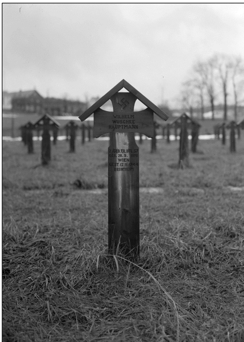
Figur 6. Mønekors på Havstein utformet som et jernkors. Eies av Sverresborg Museum / Schrødersamlingen.

på gravmarkører på andre tyske æreskirkegårder i landet. På Ekeberg i Oslo vises for eksempel mønekors markert med jernkors heller enn en svastika. Andre steder igjen kunne det være både hakekors og jernkors på gravmarkørene. Disse små variasjonene i utforming viser at det var rom for ulik utførelse, selv om det åpenbart lå en felles tradisjon bak utformingen, noe som kanskje kan vise til ulik praksis, kultur, ønsker eller behov hos den avdeling eller offiser som hadde ansvar for kirkegården.