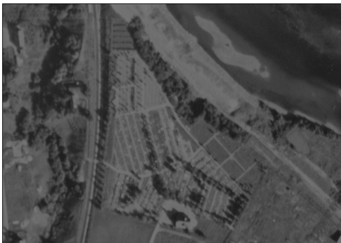
Figur 1. Flyfoto av Stavne kirkegård fra 1947.

Stavne gravlund og kapell ligger på et nes på vestsiden av Nidelvas breidd og ble innviet som kirkegård i 1916 for Ilens sogn. Stavne kapells gravprotokoll viser at bisettelser av tyske soldater begynte i de første par ukene av krigen. I begynnelsen av mai 1940 er disse gravene imidlertid flyttet til en annen del av Stavne. 30 Dette antyder at de i april ble begravd på den sivile kirkegården, men deretter flyttet til den nyetablerte æreskirkegården noen uker senere. Hvorfor akkurat Stavne ble valgt som gravsted, er ukjent. Stavne ligger fint til ved Nidelva, men noe bortgjemt i landskapet og rett ved et jernbanespor. Det er tvilsomt at Stavne var påtenkt som et større anlegg helt fra starten, men at det heller var plass og tilgjengelighet som avgjorde at de første bisettelsene fant sted her.