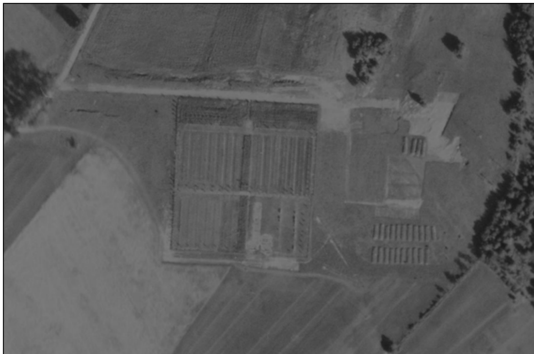
Figur 4. Havstein i 1947. Utstrekningen er den samme som i dag, men gravorganiseringen ble endret i 1955.

anlegget stod et høykors av treverk. 55 Ved krigsslutt var det sannsynligvis over 1000 graver på stedet, noe som bekreftes i en oversikt fra Gorduskompaniet fra 1955 som beskriver 1033 graver på Havstein. 56